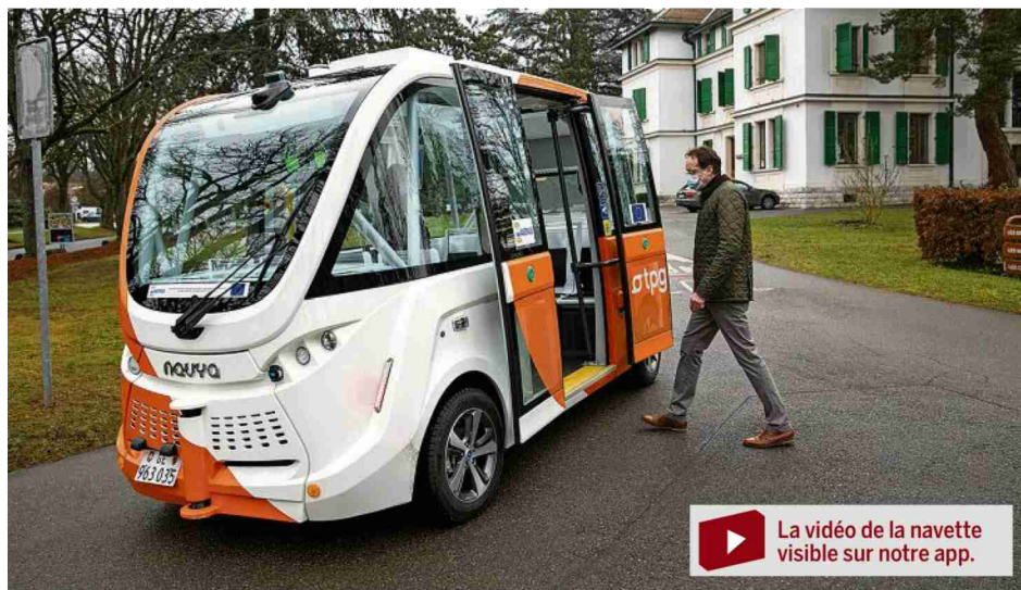
L'accès aux navettes de ce projet des TPG sera gratuit, notamment pour les 3000 employés des HUG. –KEY

on les commandera via une application mobile. Fait notable, il n'existera pas de trajet fixe – 53 lieux ou arrêts virtuels ont été cartographiés. Un logiciel adaptera le parcours aux demandes.